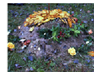
links: Medizinrad mit Tor, mittiger Feuerstelle und Schwitzhütte oben: Schildkröten-Altar